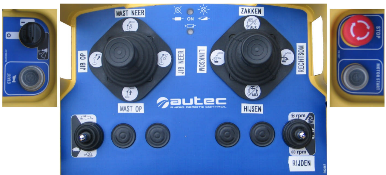
Afbeelding 1. Autec afstandsbediening linkerzijde / bovenzijde / rechterzijde