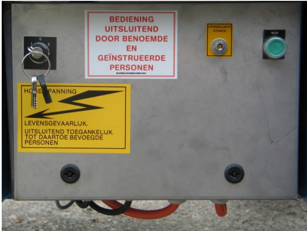
Afbeelding 2. Bouwma BY400P elementenestelmachine: schakelkast buitenzijde