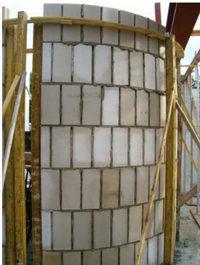
Verticaal vermetselde lijmblokken.

Sommige producten kunnen eventueel ook verticaal worden vermetselt of verlijmt, de hoogte van het product wordt dan de lengte. De onvlakheid die vervolgens ontstaat kan worden afgelezen uit de tabellen van de stenen en blokken.