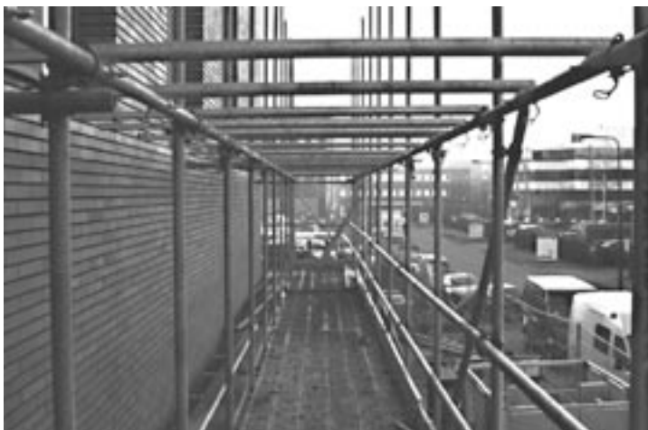
Zo hoort het wel