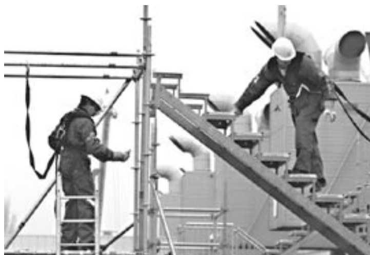
Goede werkkleding en persoonlijke beschermingsmiddelen zijn noodzakelijk om het werk veilig en gezond te kunnen uitvoeren

Gebruik veiligheidsgordels op plaatsen waar onvoldoende afscherming is. Moderne lichtgewicht veiligheidsgordels zijn prettiger en lichter te dragen dan de klassieke zware modellen. Vooral bij plaatsgebonden werk kan dit goed; gebruik een korte lijn met demper en speciale haak of span, bij mobiel werk draagkabels waar de veiligheidslijnen aangehaakt worden met een geremde katrolverbinding.