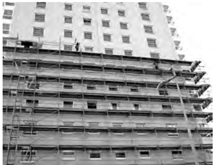
Voorkom eenzijdige belasting en wissel werkzaamheden af

Oplossing(en) door: steigerbouwbedrijf Randvoorwaarden: iedereen moet alle werkzaamheden kunnen uitvoeren en daarom eventueel deelnemen aan enkele opleidingen Toepassing: bij alle voorkomende steigermontage en -demontage werkzaamheden Rendement: neutraal Arbo-effect lichamelijke belasting: +