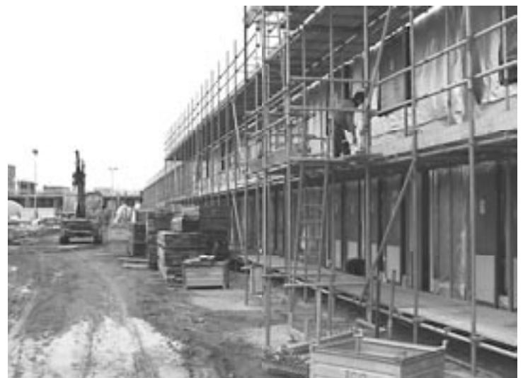
Opslag op de werkplek

Oplossing(en) door: steigerbouwbedrijf, materieeldienst, steigerbouwer Randvoorwaarden: goede planning van de tussenopslag Toepassing: bij alle projecten Rendement: sneller werken Arbo-effect lichamelijke belasting: +