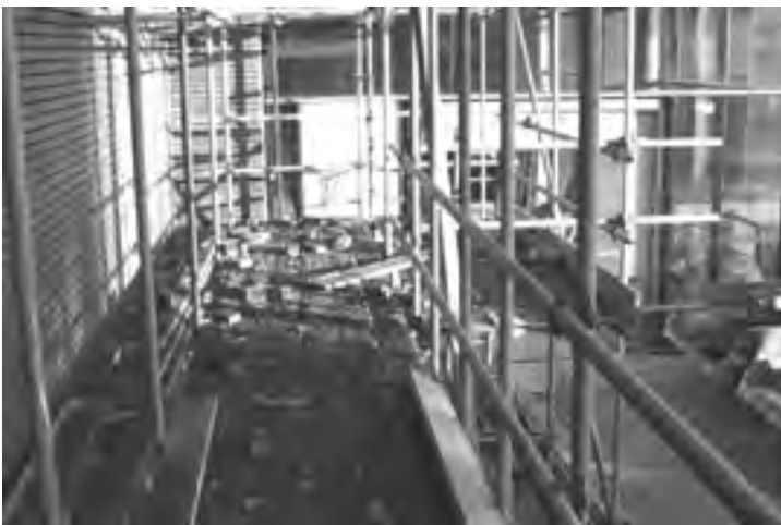
Zo hoort het niet

Oplossing(en) door: opdrachtgever, steigerbouwbedrijf, gebruikers Randvoorwaarden: geen Toepassing: in alle steigerbouwprojecten Rendement: sneller werken Arbo-effect lichamelijke belasting: +