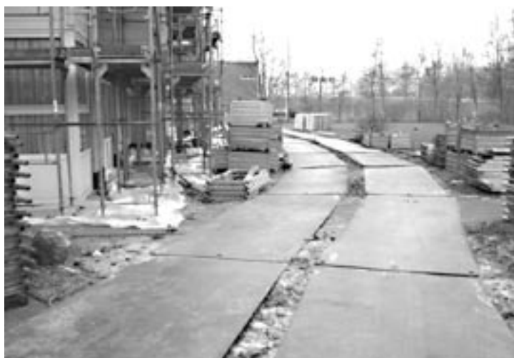
Goede transportwegen zijn noodzakelijk voor mechanisch transport van steigerelementen

Oplossing(en) door: opdrachtgever Randvoorwaarden: goede beheersing van de planning Toepassing: bij alle projecten Rendement: sneller werken Arbo-effect lichamelijke belasting: ++