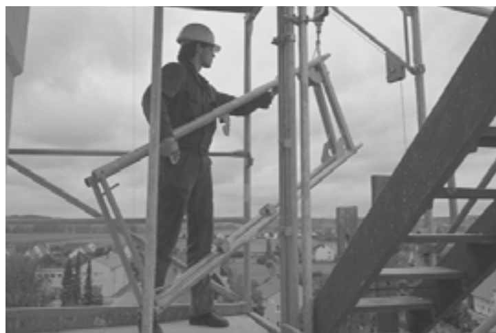
Het gebruik van een hijslier om het werk te verlichten is goed. Let op: bij het werken op hoogte moet adequate valbeveiliging worden gedragen/gebruikt, deze situatie is niet veilig.

Een andere manier om het werk te verlichten, is het inzetten van transporthulpmiddelen. Hierdoor hoeft er minder met de hand te worden getild en gesjouwd. De inzet van transporthulpmiddelen kost geld. Daar staat tegenover dat de aan- en afvoer van de steigerelementen met deze hulpmiddelen veelal sneller en dus goedkoper is. Er zijn verschillende mogelijkheden om het horizontaal en verticaal transport te verbeteren. Er zijn verschillende hulpmiddelen beschikbaar zoals: heftrucks, verreikers, ladderwagens, kranen, tractors met platte wagen, liften, takels, hijslieren en (hand)karren.