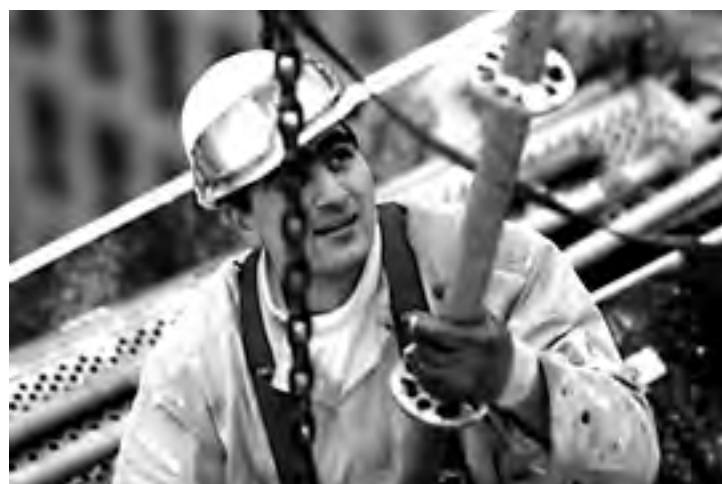
Toepassen van een goede werktechniek maakt het werk minder zwaar